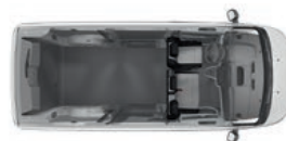
FURGÓN 6.1 m 3 1,400 kg